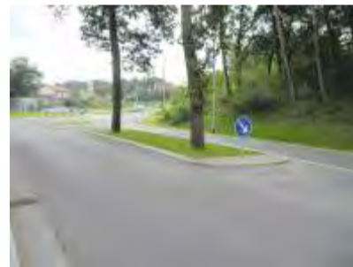
Ortsdurchfahrt Friesack Knoten B5/L17 B5 aus Richtung Nauen (großes Bild links), L17 Klessener Straße (Bild oben)