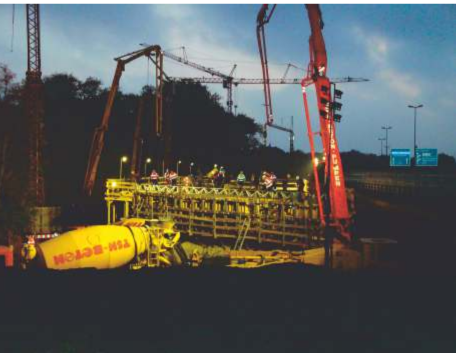
BSW 7 – Betonieren bei Nacht und bei Tag (Bild unten)

LINDSCHULTE+SCHULZE hatte die im Behördenentwurf vorgesehenen acht Betonierabschnitte in mehreren Schritten auf vier optimiert. Durch dieses Nebenangebot erhielt die Firma EUROVIA den Auftrag.